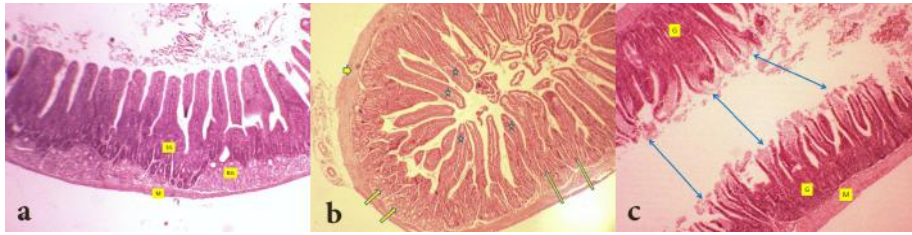
شکل ۱: تصویر میکروسکوپی دوازدهه؛ بزرگ نمایی ۴۰×؛ رنگ آمیزی H&E a: گروه کنترل تیمار شده با پروتئین کامل؛ کرک‌های روده‌ای (علامت ستاره)؛ غدد لیبرکوهن در آستر مخاط (فلش‌های بلند)؛ غدد بروئر در زیرمخاط (فلش‌های کوتاه)؛ طبقات عضلانی (نوک فلش). b: موش‌های آزمایشگاهی تیمار شده با پروتئین کامل حاوی ۴۰ درصد سویا؛ کنده‌شدگی راس کرک‌ها (فلش‌های دوسر)؛ غدد لیبرکوهن (G)؛ طبقه عضلانی (M) c: موش‌های آزمایشگاهی تیمار شده با پروتئین کامل حاوی ۲۰ درصد سویا؛ بخش‌هایی از دیواره دوازدهه با کرک‌های طبیعی و در آستر مخاط غدد لیبرکوهن (LG)؛ غدد بروئر (BG)؛ طبقه عضلانی (M)