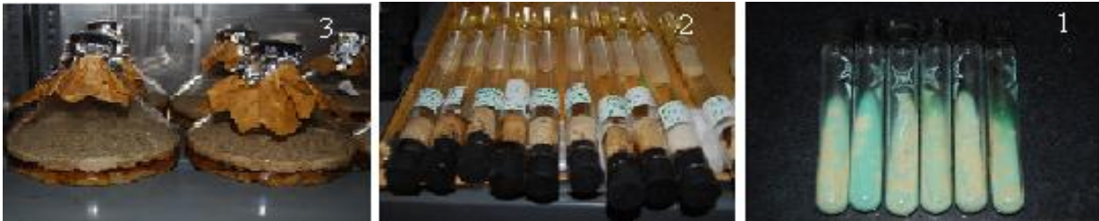
تصویر 1: رشد باکتری بر روی سه محیط متفاوت شامل 1- محیط کشت جامد لونشتاین جانسون. 2- محیط کشت دوفازی سیب زمینی-دورس هنلی. 3- محیط کشت مایع دورس هنلی

انتقال و رشد باکتری بر روی هر سه محیط فوق به درستی انجام گرفت (تصویر 1).