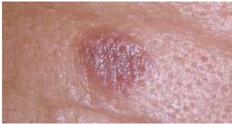
شکل ۱: پاپول اریتماتوز در ناحیه پیشانی

گرانولوم فاشیال به طور تیپیک با ضایعات ندولار و بدون علامت روی صورت مشخص می‌شود. اما گاهی درگیری پوست در نواحی غیر از صورت نیز دیده می‌شود. در این بیماری درگیری سیستمیک وجود ندارد و تشخیص قطعی گرانولوم فاشیال بر اساس مشاهدات بالینی و آسیب‌شناسی می‌باشد. این بیماری نسبتاً نادر است و اغلب در مردان میانسال دیده می‌شود (۱).