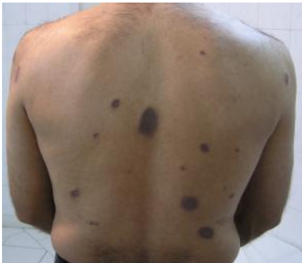
شکل ۲: پاپول‌ها، پلاک‌ها و ندول‌های اریتماتوز متمایل به بنفش در ناحیه پشت

در معاینه پوست ندول‌ها و پلاک‌های اریتماتوز همچنین به رنگ پوست در ناحیه پشت، بازوها و در ناحیه پیشانی مشهود بود. در سطح بعضی از ضایعات Follicular opening و تلائزکتازی دیده شد. در معاینه سیستمیک بیمار نکته غیرمعمول یافت نشد (شکل‌های ۱ و ۲ و ۳).