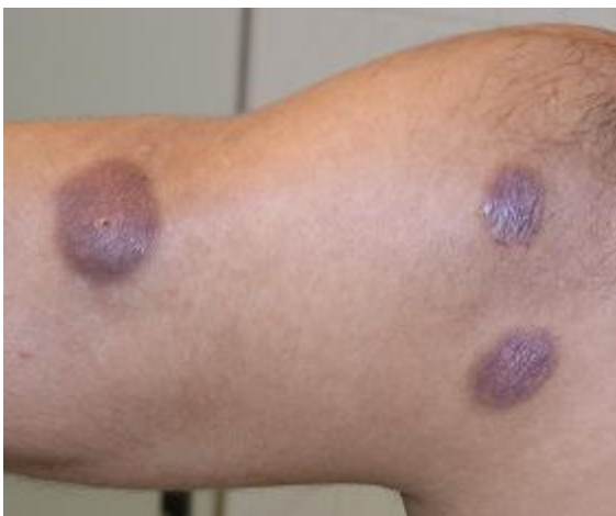
شکل ۳: پلاک‌های اریتماتوز متمایل به بنفش در ناحیه بازو

در آزمایشات به عمل آمده (اسمیر خون محیطی، CBC، Diff، سدیماتاسیون، S/E Liver function tests و U/A) و