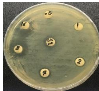
سالمونلا اینترتیدیس ATCC 13076