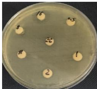
جدایه سالمونلا اینترتیدیس

شاهد مثبت: دیسک آغشته به استات روی با غلظت ۸ میلی‌گرم بر میلی‌لیتر، شاهد منفی: دیسک آغشته به آب مقطر