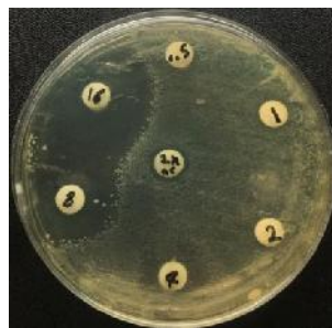
جدایه باسیلوس سرئوس