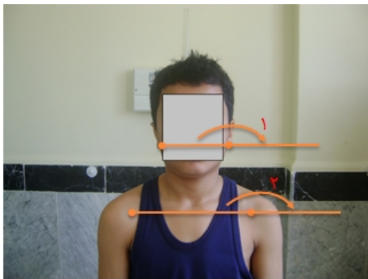
شکل ۲: روش اندازه‌گیری کج گردنی و شانه نابرابر (۱) زاویه کج گردنی، (۲) زاویه شانه نابرابر